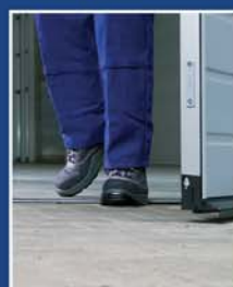
Вградена врата без праг

Сега всички секционни врати на Hörmann с ширина до 7000 мм и вградена врата са без праг. Освен това, при автоматичен режим на обслужване, те са допълнително оборудвани с фотоклетка, гарантираща спиране на движението без допир с вратата.