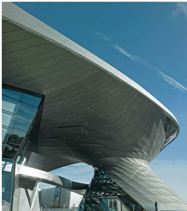
BMW Welt, Мюнхен