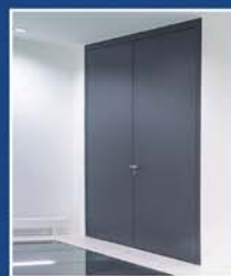
Съосни STS-стоманени врати

Hörmann Ви предлага най-голямата европейска програма за противопожарна защита. Пълна противопожарна и димозащита от стомана и алуминий, T30/60/90, врати с универсален дизайн и идентична визия. За перфектни архитектурни решения: съосни, безфалцови STS-стоманени врати.