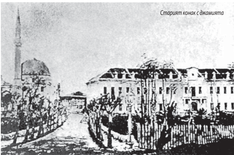
Старият конак с джамията

Възпоменанието ще се извърши на 20.08.2010 г. от 18.00 ч. в Клуба на Съюза на архитектите в България на ул. „Кракра“ 11, София.