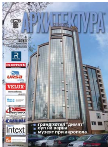
■ Гранд хотел "димитар" ■ Оуп на варна ■ музей при акропола